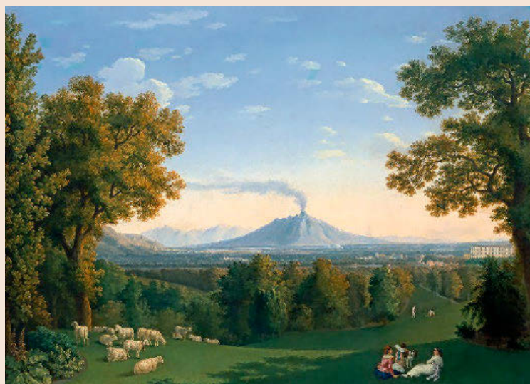
La pintura de Jacob Philipp Hackert 'Paisaje con el palacio de Caserta y el Vesubio' fue la que sirvió de inspiración a Berasategui, que vio un paisaje similar al del País Vasco en la obra.

Andoni Luis Aduriz, Martín Berasategui, Víctor Arguinzoniz, Quique Dacosta, Paco Morales, Ricardo Sanz, Ángel León, Oriol Balaguer o Juan Mari y Elena Arzak recorrieron las salas de la pinacoteca madrileña buscando inspiración en una de las obras que aloja y cada uno realizó una receta original a partir de ella. La idea no era trasladar la estética de dicho cuadro, sino que éste sirviera como inspiración para hacer otra obra de arte, esta vez en el plato. Así los chefs sirven en una mesa imaginaria, pero que el lector puede convertir en realidad ya que se establecen los ingredientes de cada receta y los pasos que hay que seguir, Venecia era toda oro (1961) de Lucio Fontana; Paisaje con el palacio de Caserta y el Vesubio (1793) de Jacob Philipp Hackert; Un arroyo en el bosque (1865) de Asher B. Durand; Quappi con suéter rosa (1932-1934) de Max Beckmann; El lago Greenwood (1870) de Jasper Francis Cropsey; Caballos de carreras en un paisaje (1894) de Edgar Degas; Omega 5 (1912) de Paul Klee; Vestidos simultáneos (1925) de Sonia Delaunay; o Composición de colores (1931) de Piet Mondrian.